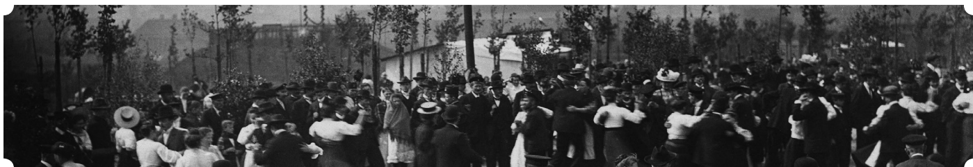
Konig Grube – zabawa taneczna