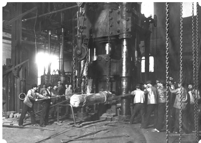
Zakłady Huldshynskiego w Gliwicach – wielka prasa

Widowisko taneczne w wykonaniu aktorów Teatru Śląskiego według koncepcji Rafała Urbackiego to spektakl – reportaż o historii hutnictwa, łączący choreografię, koncert muzyki elektronicznej i sztukę wizualną. Materiał filmowy z wyburzonych hut oraz fragmenty wypowiedzi hutników stają się podstawą choreografii tancerzy, do której w finale przyłączą się widzowie. Punktem wyjścia do działań aktorskich jest zaś tutaj opowieść byłego hutnika, dotycząca roboczych ubrań, które po