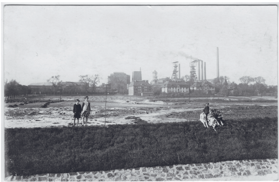
Katowice, widok na kopalnię od strony Rawy ok. 1925 r.